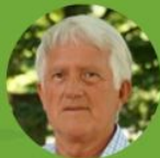
Georg Schirmbeck President of the German Forestry Council